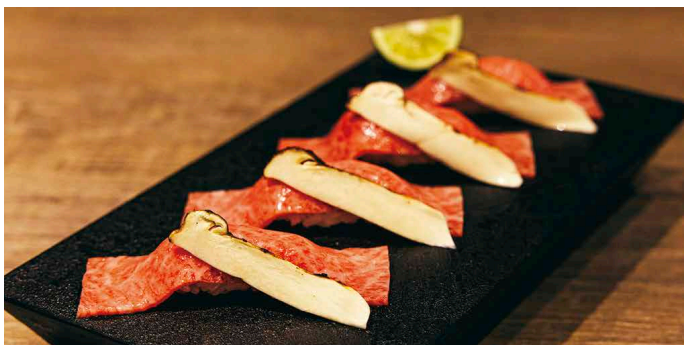
松茸とザブトンの炙り握り 1,600円

厳選した和牛赤身に美しい紅色の「新しくら」を合わせました。新しくらのプチとした食感と赤身の凝縮した旨みをご堪能いただける、贅沢な組み合わせのユッケです。