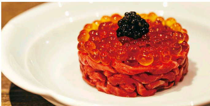
新しくらと和牛のタルタル 2,900円

厳選した和牛赤身に美しい紅色の「新しくら」を合わせました。新しくらのプチとした食感と赤身の凝縮した旨みをご堪能いただける、贅沢な組み合わせのユッケです。